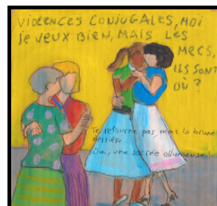
Dominique Cozette - Violences conjugales Acrylique sur carton

Dernières expositions : salon Mac Paris en 2010 et 2009, galerie l'Aiguillage aux Frigos, Artcity à Fontenay-sous-Bois (94), Salon Comparaisons au Grand Palais en 2009, Pleins Feux sur Ivry, les 111 des Arts à Lyon, la Maison de la Tour à Valaurie (26).